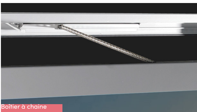
Boîtier à chaîne